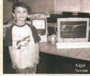
Gazete haberi (2)

cümlelere yer verdi: "Sıfıfta Kurtuluş Savaşı'nın CD'sini izledim. Bu CD'de Türk bayrağını taşıyan asker yaralandığı için bayrak elinden kaydı. Ama başka bir Türk askeri bayrağı yakaladı. Kurtuluş Savaşı boyunca bayrağımız hiç ayaklar altında kalmadı... Sen planlı çalıştığın için ülkeyi kurtardın. Ben de senin gibi sabırlı ve disiplinliyim." Yarışma birincisi bir bilgisayar ile ödüllendirildi.